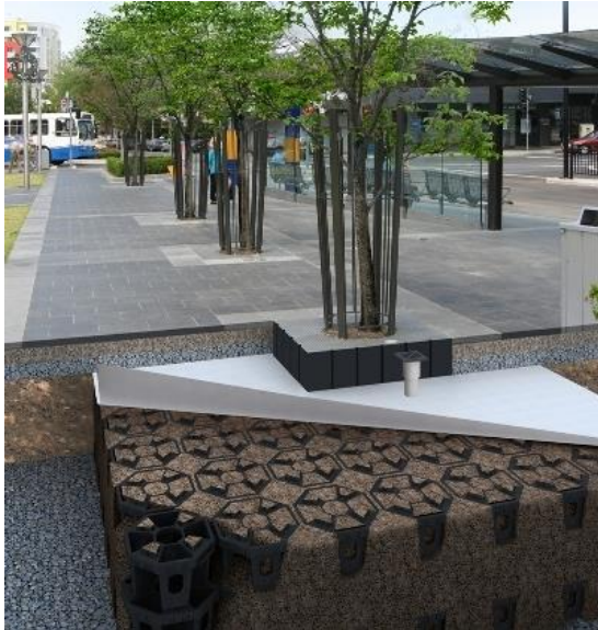
Abb. zu Variante 3 - Neupflanzung Wurzelkammersystem