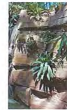
Bild 3: Gestaltungsbeispiel einer partiellen Kunstfelsenverbindung im Farnhaus