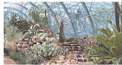
Bild 1: Gestaltungsbeispiel Höhenreliefform Beetgestaltung Kakteenhaus