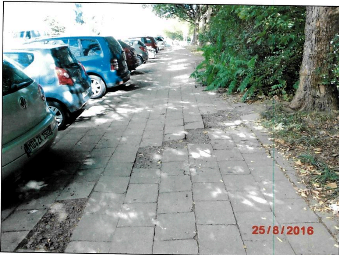
Ausbrüche im Gehweg aufgrund des vorhandenen Baumbestandes (Wurzeltrieb). Keine ausreichende Verkehrssicherheit gegeben.