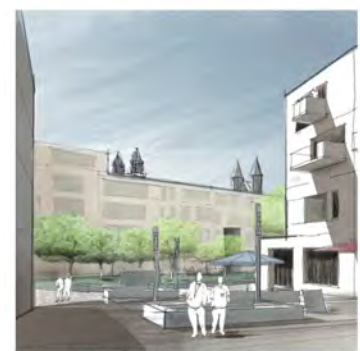
Perspektive STADT.SPIEL.PLATZ vom Parkdeck Alleen-Center