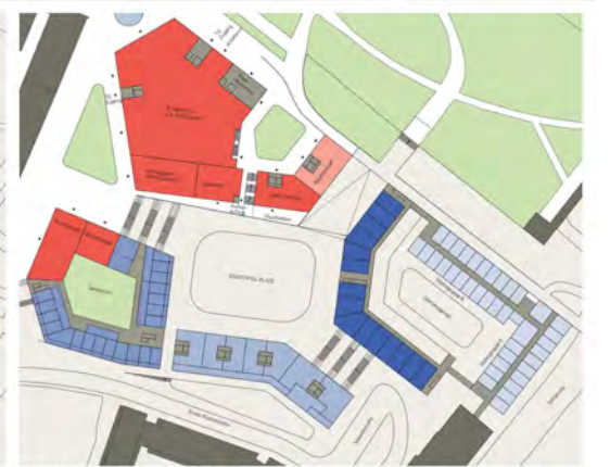
Grundriss Erdgeschoss Wobau-Welle / 2. Obergeschoss Demenzzentrum Höhe ±0.00 m = 55.70 m UNN / M 1:500