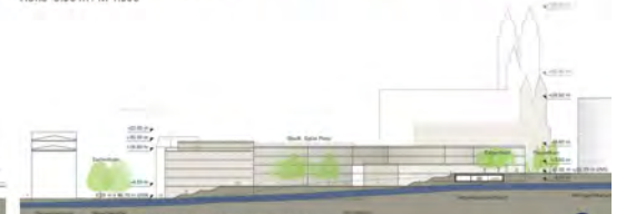
Ansicht Schnitt STADT.SPIEL.PLATZ Ost West M 1:500