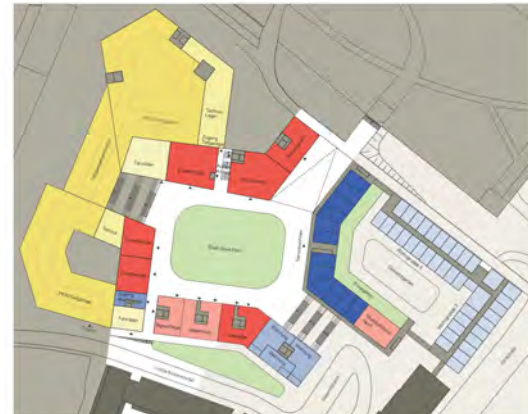
Grundriss Erdgeschoss STADT.SPIEL.PLATZ / 1. Obergeschoss Demenzzentrum Höhe -4.50 m / M 1:500