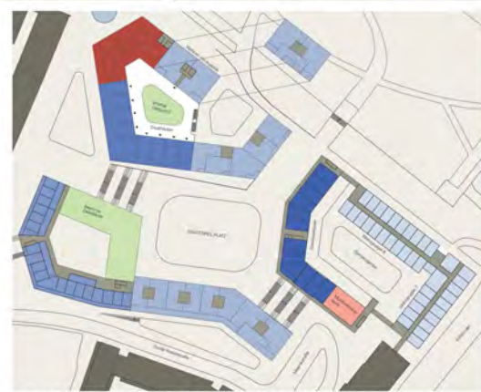
Grundriss 1. Obergeschoss Wobau-Welle / 3. Obergeschoss Demenzzentrum Höhe +4.50 m / M 1:500