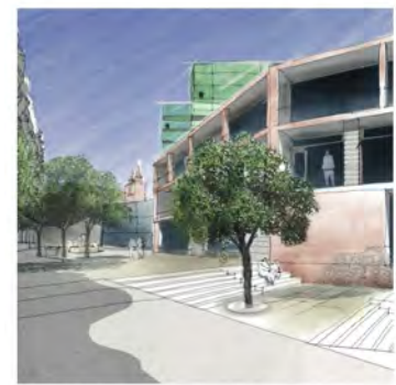
Perspektive vom Kloster zum Wettbewerbsareal