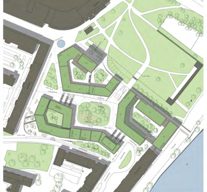
Lageplan M 1:500