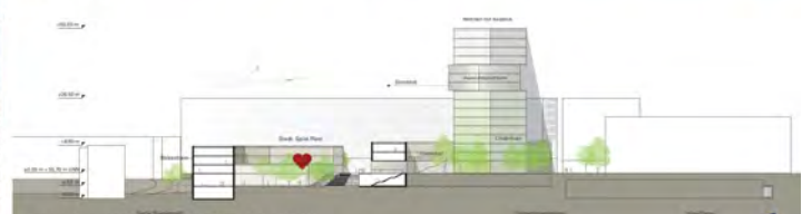
Ansicht Schnitt STADT.SPIEL.PLATZ Nord Süd M 1:500