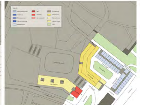
Grundriss Erdgeschoss Demenzzentrum Höhe -0.00 m / M 1:500