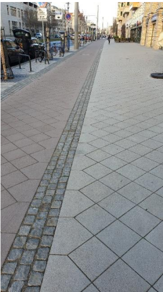
Abbildung 1: Breiter Weg Südabschnitt