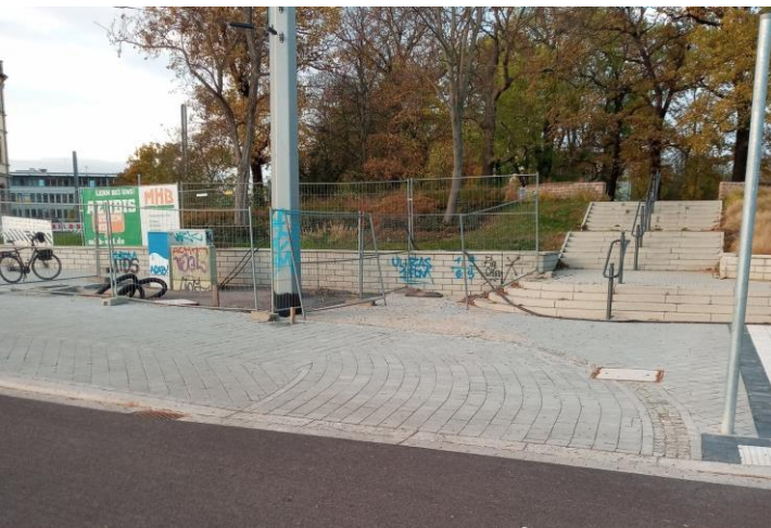
Abb. 5: Baustelle im Dezember 2020